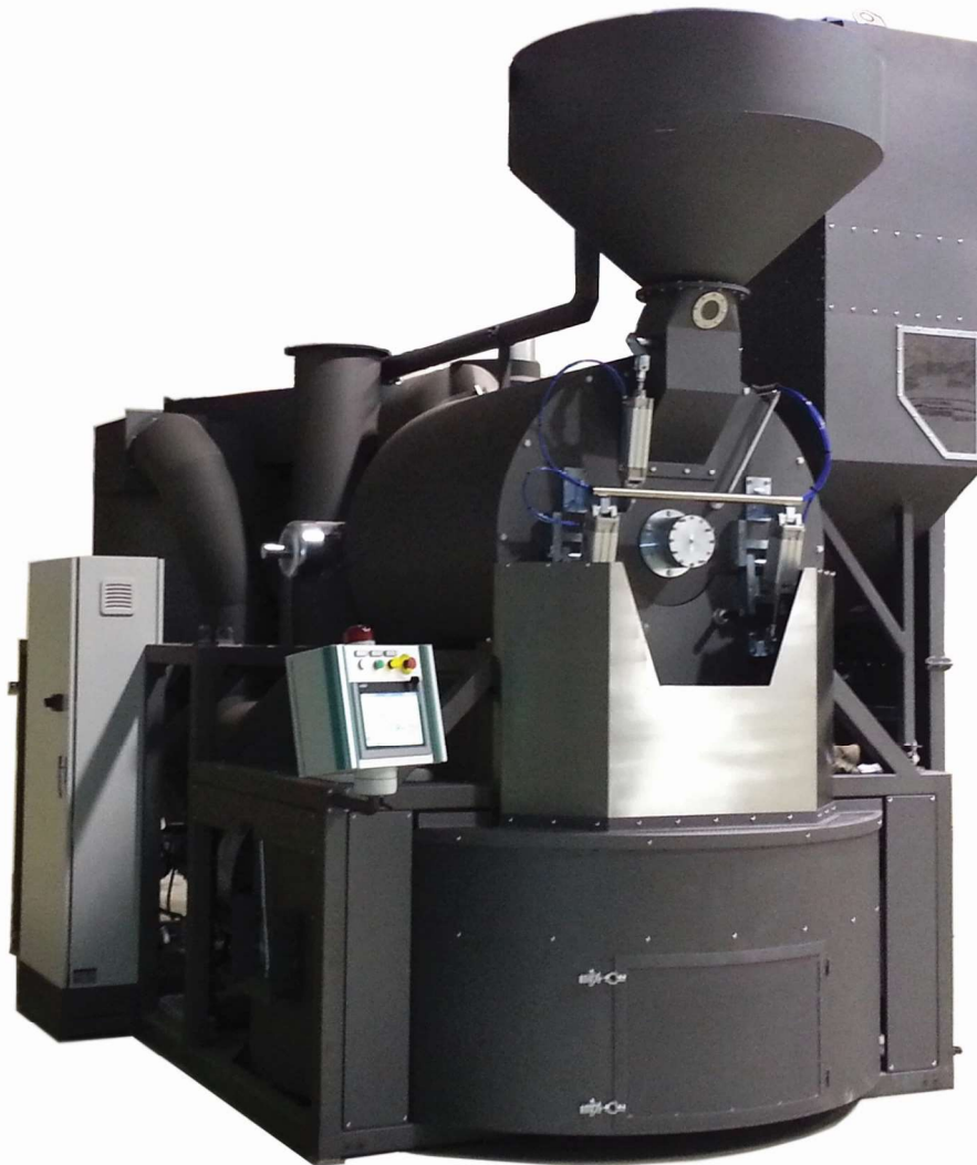
_Modello: RM240 RAS